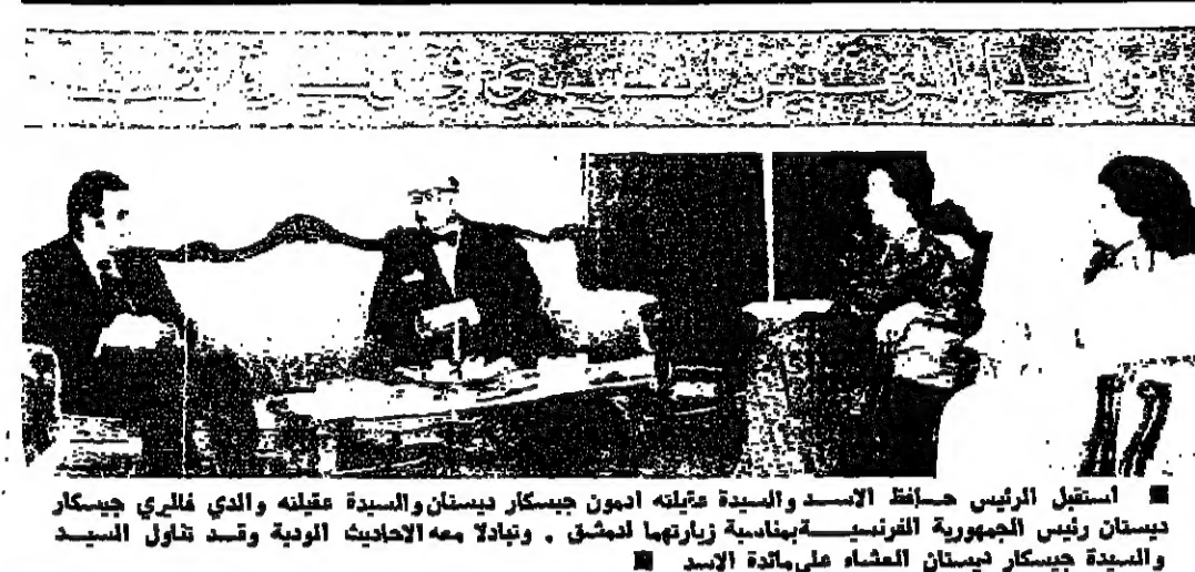
استقبل الرئيس حافظ الاسد والسيدة عاتلة امون جيسكار ديستان والسيدة جيسكار ديستان الفرنسية بمناسبة زيارتهما لمشق . وتبادلوا معه الاحاديث الودية وتعد شاول السيد